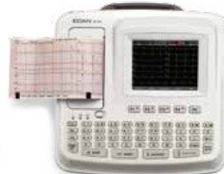
(5,6-дюймовый цветной ЖК-дисплей)