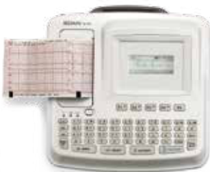
(3,5-дюймовый монохромный ЖК-дисплей)