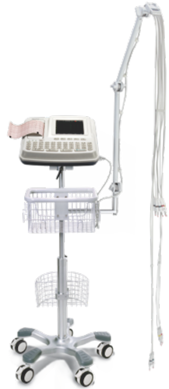
SE-601CC подвижной подставкой (5,6-дюймовый цветной сенсорный экран)