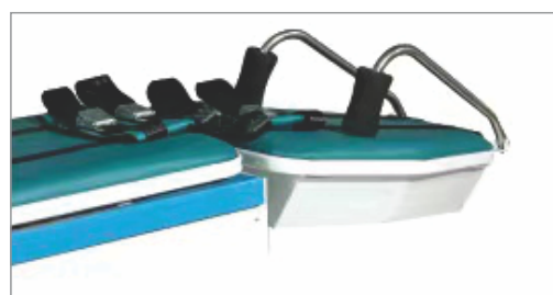
Угол наклона вниз 10^\circ