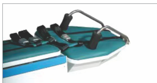
Угол вращения \pm 25^\circ