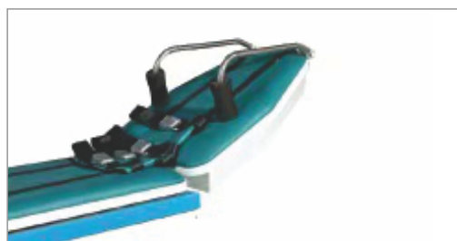
Угол наклона вверх 30^\circ